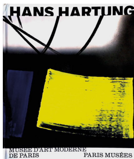
Paris: Éditions Paris Musées, 2019, 271 Seiten