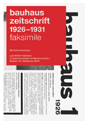
Berlin : Lars Müller Publishers, 428 pages