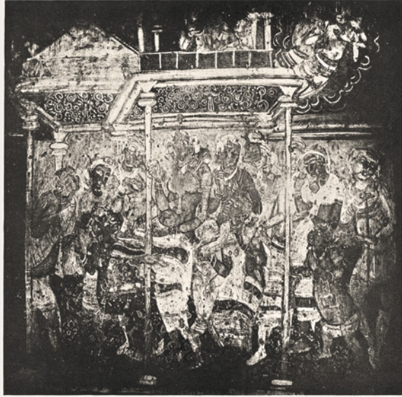
AJANTA, GROTTTE II: WANDMALEREI IV