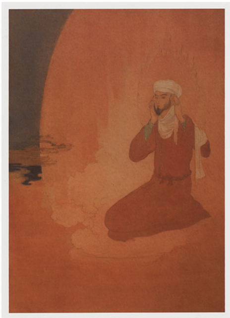
Abb. 9: Abanindranath Tagore, Summer , aus der Serie Ritusamhara , ca. 1900. Aquarell, 22,9 × 12,3 cm, Indian Museum, Kolkata. Abbildung in: Siva Kumar, The Paintings of Abanindranath Tagore , Kolkata: Pratikshan, 2008, S. 72.

Abb. 10: Abanindranath Tagore, Dewali , ca. 1903. Aquarell, 21,6 × 15,3 cm, Indian Museum, Kolkata. Abbildung in: Siva Kumar, The Paintings , op. cit., S. 75.