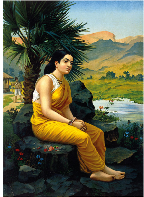
Abb. 4: Raja Ravi Varma, Shakuntala's impending Calamity , 1901. Öl auf Leinwand, Sammlung: Government Museum, Chennai. Abbildung in: Rupika Chawla, Raja Ravi Varma. Painter of Colonial India , Ahmedabad: Mapin Publishing, 2010, S. 191.