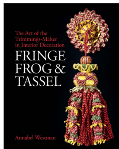
London: Bloomsbury Publishing, 2019, 288 Seiten