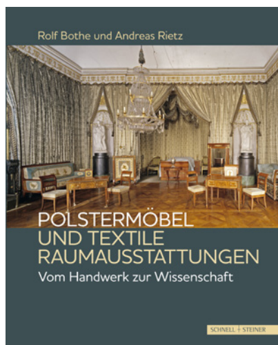
Regensburg: Schnell & Steiner, 2019, 256 Seiten