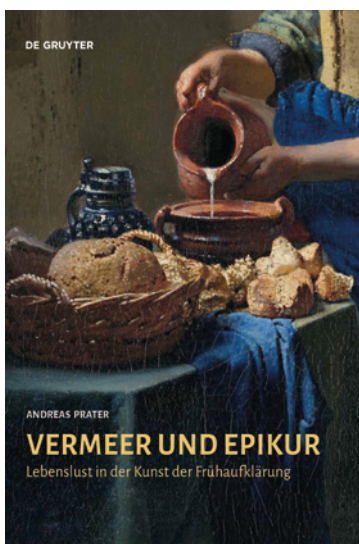
Berlin : De Gruyter, 2021, 196 pages