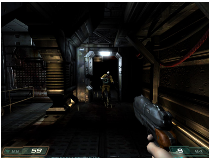
Ill. 3 : id Software, DOOM 3 , 2004