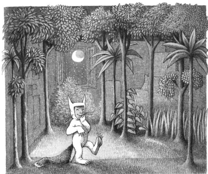
Abb. 4: aus: Maurice Sendak, Where the Wild Things Are , New York: Harper & Row, 1963, o. S.

Ill. 3 : extraite de : Maurice Sendak, Where the Wild Things Are , New York : Harper & Row, 1963, s. p.