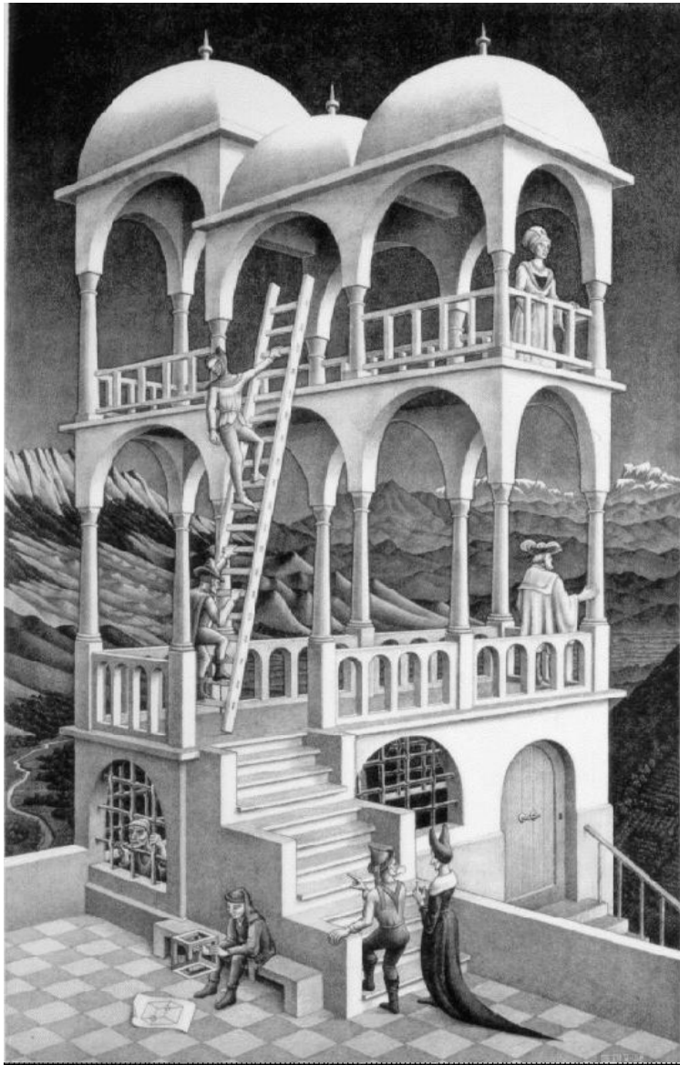
M. C. Escher, Belvedere , 1958

Un monde pour un autre ou les rhétoriques de l'exemple dans les manuels de microéconomie