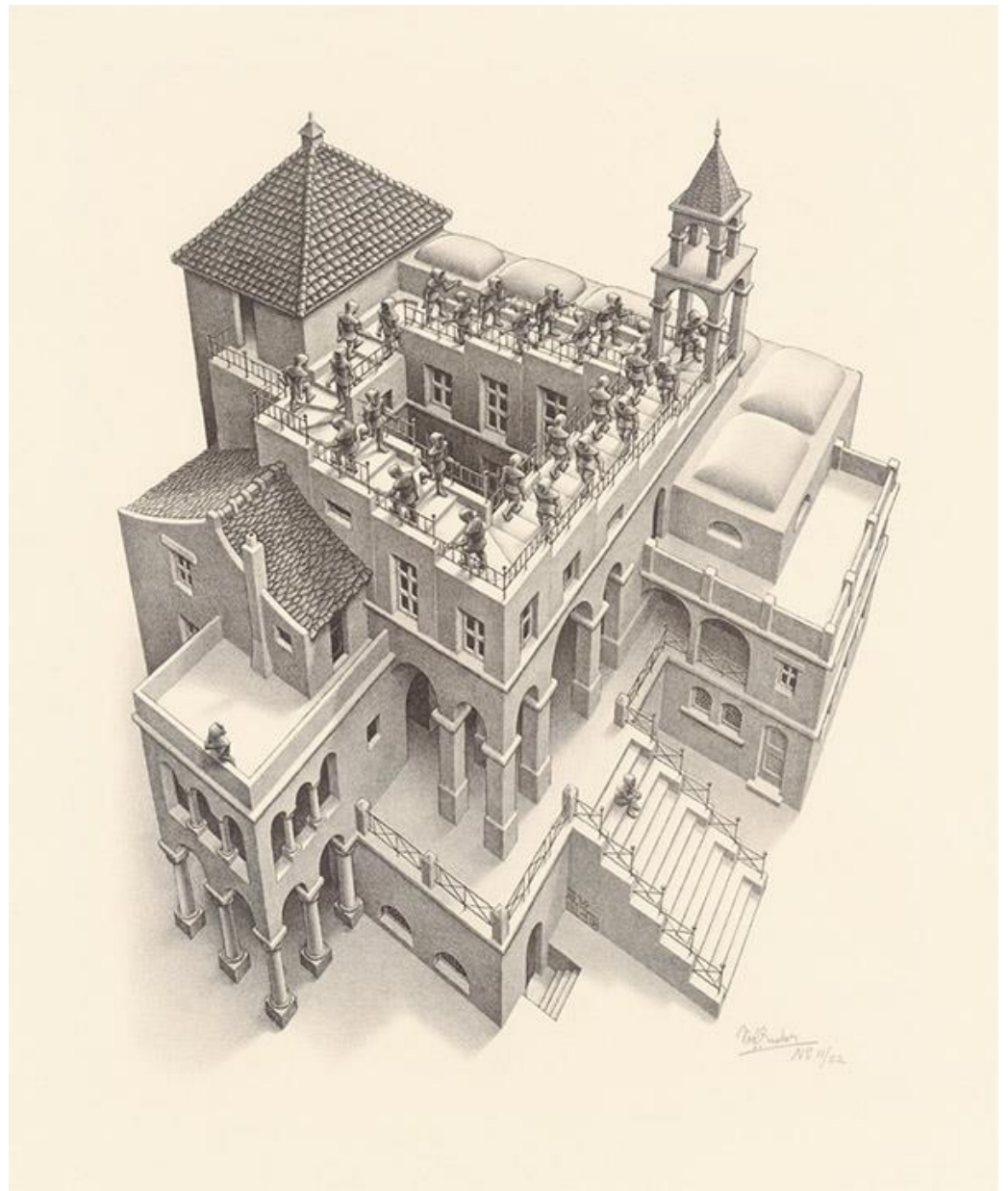
M. C. Escher, Ascending and Descending , 1960