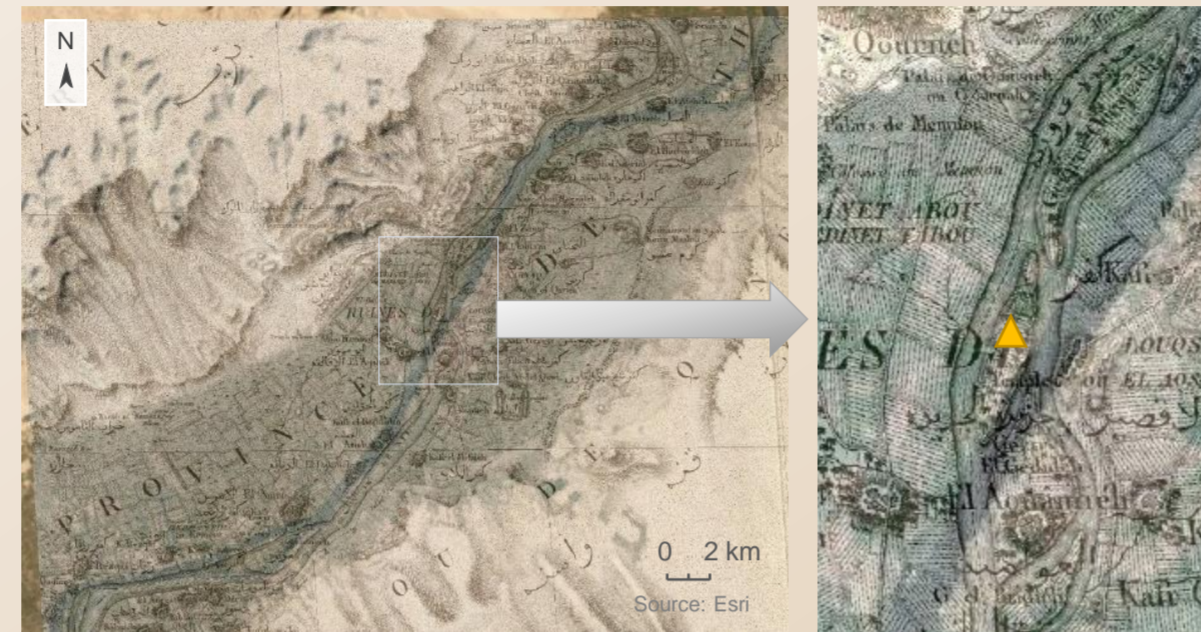
Légende: ▲ Ile de Bayrat

• L'analyse de la cartographie disponible de la région s'avère décisive pour mieux comprendre les changements anthropiques et géomorphologiques survenus dans les derniers 200 ans dans la plaine alluviale et leurs temporalités.