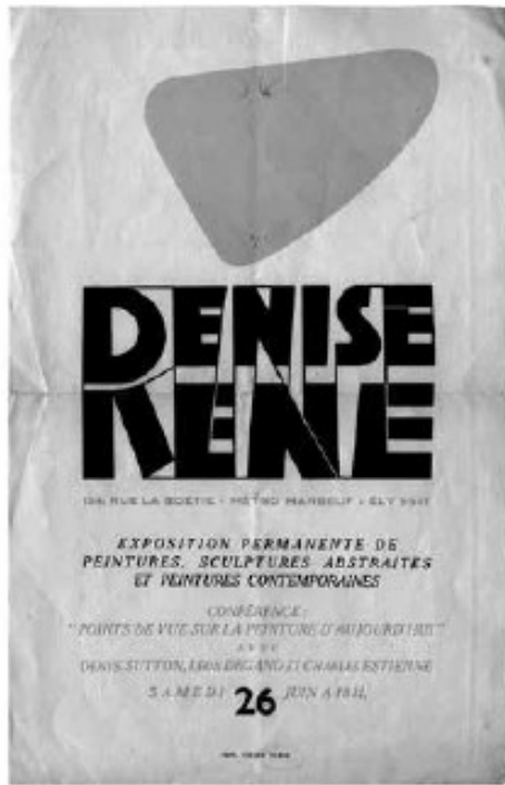
▲ Fig. 6 – Invitation à la conférence « Points de vue sur la peinture d'aujourd'hui » à la galerie Denise René, 26 juin 1948.

L'incertitude fondamentale sur la valeur de l'avant-garde favorise l'intervention d'acteurs possédant une bonne connaissance du monde de l'art et de son histoire et dont la capacité à déterminer la qualité future de l'œuvre est socialement reconnue : ce sont les nombreux et divers médiateurs et médiatrices dont Howard Becker a bien montré comment ils s'affairent de concert à construire des indices de valeur pour l'œuvre 17 . Indices marchands (galeristes, courtiers), indices esthétiques (critiques, historiens), indices symboliques (collectionneurs, acquéreurs), dont la force, la portée et la prégnance apparaissent autant sinon plus déterminantes que l'œuvre elle-même. Comprendre comment l'abstraction devint respectable n'est ainsi pas possible sans faire l'histoire des acteurs, hommes et femmes (le genre se révèle ici une catégorie particulièrement utile de l'analyse historique), qui ont assuré ces transmissions décisives mais sont souvent méconnus.