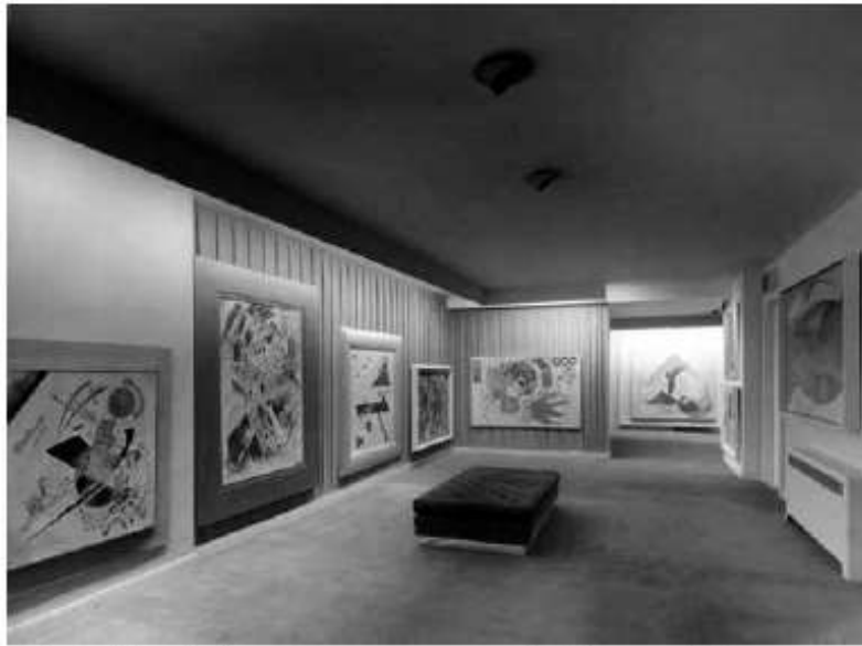
▲ Fig. 4 – Vue de l'exposition permanente du Museum of Non-Objective Painting, 1948.