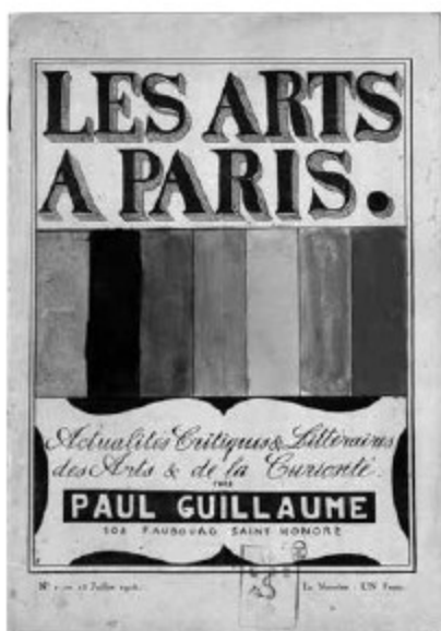
◀ Fig. 1 – Couverture du n° 2 de la revue Les Arts à Paris, juillet 1918.