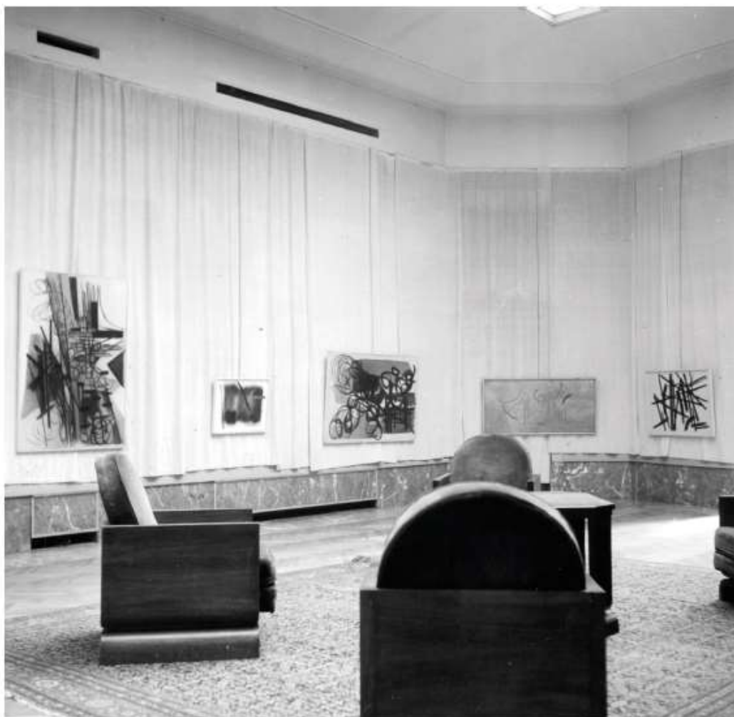
ill. 3 Vue de l'exposition «Hartung» au Palais des beaux-arts de Bruxelles, 1954