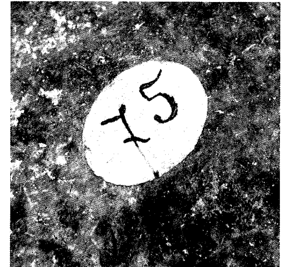
Fig. 4. Étiquette « pastille » inscrite « 75 » sur une cruche de Yortan, mise en dépôt à la Sorbonne en 1900.