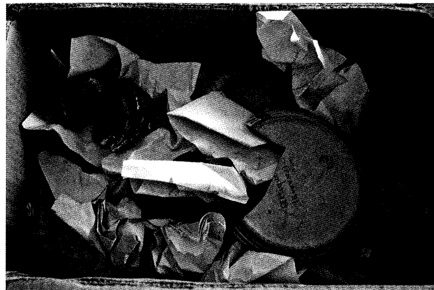
Fig. 2. Vases et fragments en vrac dans une caisse en carton, conditionnés au moyen de coupures de presse et tracts de Mai 68.

tion inédite de Délos, plusieurs fragments de sarcophage de Clazomènes, ainsi qu'un morceau de fresque de Pompéi. L'ensemble du dossier est en cours d'étude ; au terme du programme de recherche, il fera l'objet d'une publication globale et détaillée. Nous ne nous attacherons ici qu'aux seuls vases grecs, ce qui nous permettra d'exposer les grandes lignes d'une recherche en cours.