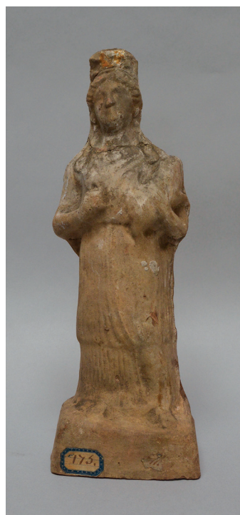
FIG. 9. – Statuette féminine debout tenant un porc [305]. Copie moderne en plâtre patiné. Haut. 24 cm. Musée du Louvre, Cp 234, mise en dépôt à la Sorbonne en 1894.

gauche [305] (fig. 9), qui porte deux étiquettes « écolier » avec les numéros 175 et 234 ; ceux-ci correspondent aux numéros attestés dans le décret de mise en dépôt de 1894 28 et dans le « Registre R.S. (objets en réserve) » rédigé par Edmond Pottier 29 , le premier numéro renvoyant à l'inventaire initial de la collection Campana ( Cataloghi ), publié avant son acquisition par la France en 1861 30 . Provenant d'Italie, la pièce – en réalité une copie moderne en plâtre patiné – est arrivée au