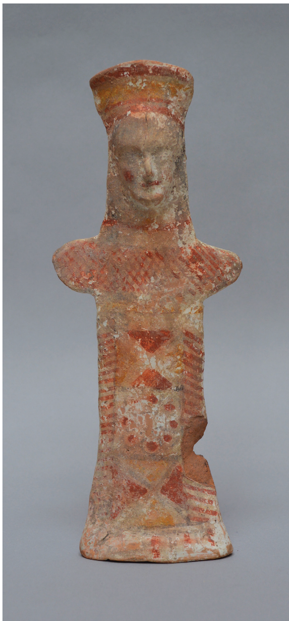
FIG. 1. – Figurine plate [204], Béotie, 2 e moitié du VI e siècle av. J.-C. Haut. 21 cm. Date et mode d'entrée dans la collection indéterminés.