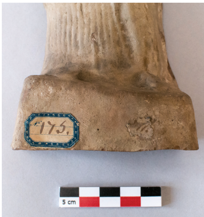
FIG. 8. – Étiquette « écolier » portant le numéro 175, apposée sur une statuette féminine debout tenant un porc [305]. Cf. fig. 9.