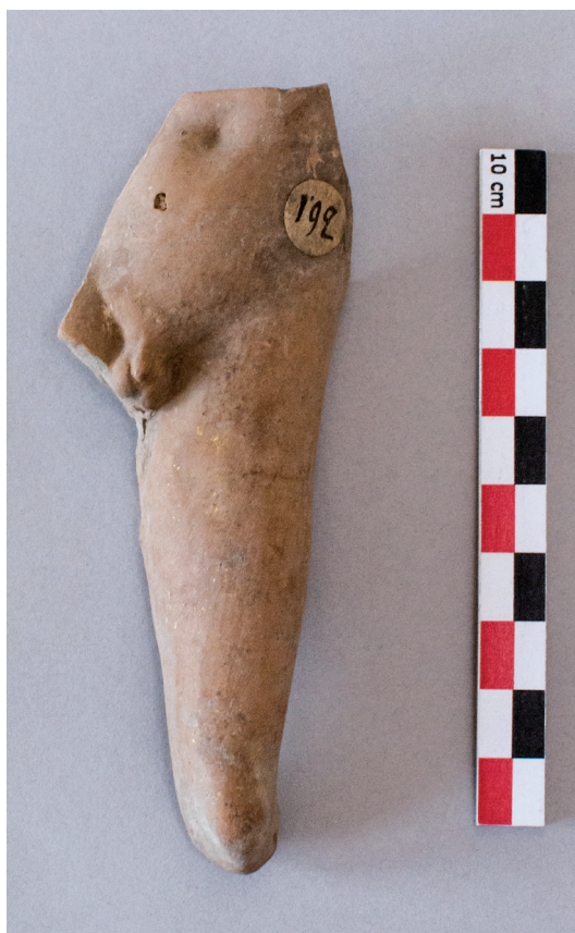
FIG. 7. – Fragment de statuette d'Éros [267], Asie mineure, III e -I er siècle av. J.-C., avec étiquette « pastille » portant le numéro 192. Don de P. Gaudin à l'Université de Paris, 1898.

figurines. Il est toutefois possible de les associer à des pièces précises grâce à la documentation établie par Simone Mollard-Besques entre 1961 et 1963.