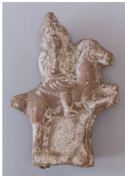
FIG. 3. – Harpocrate cavalier [201], Égypte, II e -III e siècle apr. J.-C. Haut. 19 cm. Musée du Louvre. Mis en dépôt à la Sorbonne en 1921 parmi les objets issus des fouilles d'A. Gayet à Antinoë.