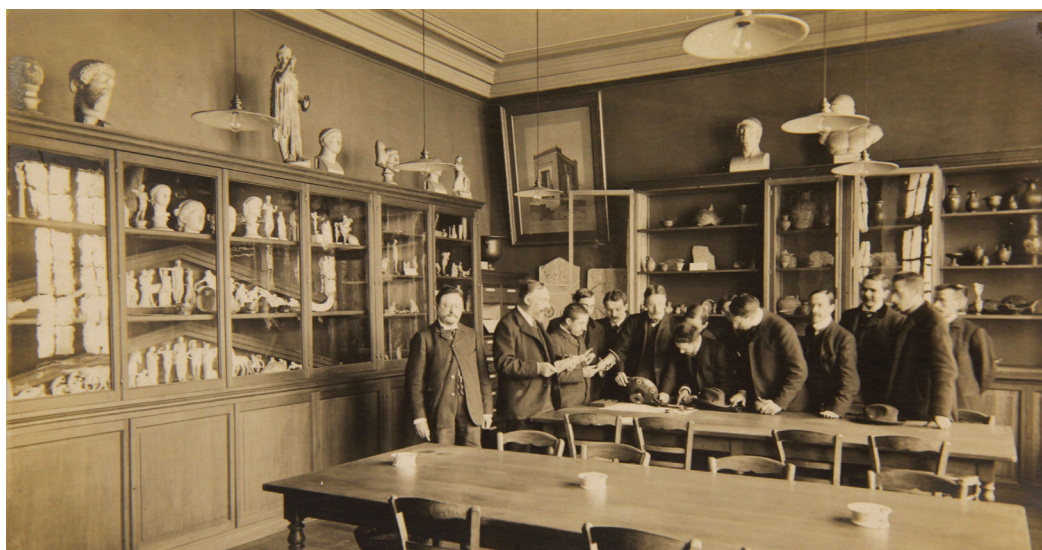
FIG. 4. – Neurdein, Salle d'archéologie . s. d.