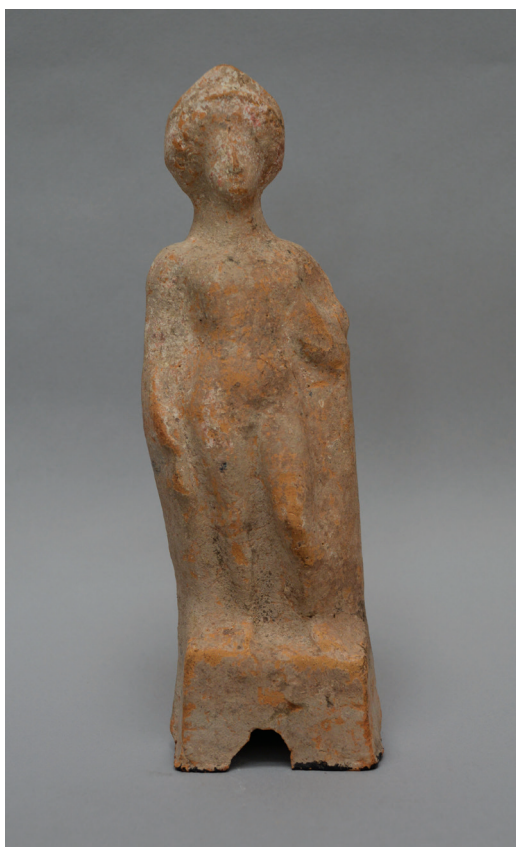
FIG. 10. – Statuette de jeune éphèbe tenant un coq [208]. Béotie, IV e siècle av. J.-C. Haut. 22 cm. Date et mode d'entrée dans la collection indéterminés.