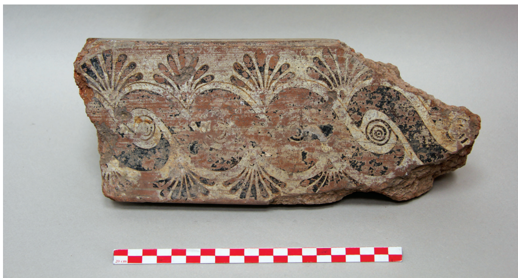
FIG. 15. – Fragment de sarcophage de Clazomènes [171]. Clazomènes, premier quart du v e siècle av. J.-C. Long. 29 cm. Don de Paul Gaudin à la Sorbonne en 1901.

d'ailleurs probablement ajouter quelques pièces non répertoriées dans la liste, qui furent numérotées à la suite de la série lors de leur fichage au Louvre (cf. supra ). Faut-il étendre le don de Gaudin à l'ensemble de ce lot, dont la cohérence est réelle ? En tout état de cause, nous serions bien en peine d'exclure certains individus pour nous limiter à 200 pièces assurément données par Gaudin à la collection archéologique de la Sorbonne.