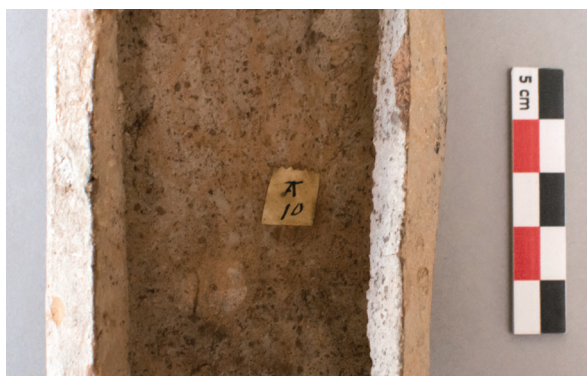
FIG. 12. – Étiquette « rectangulaire » portant le marquage « T 10 », apposée sur la statuette de jeune éphèbe tenant un coq [208].