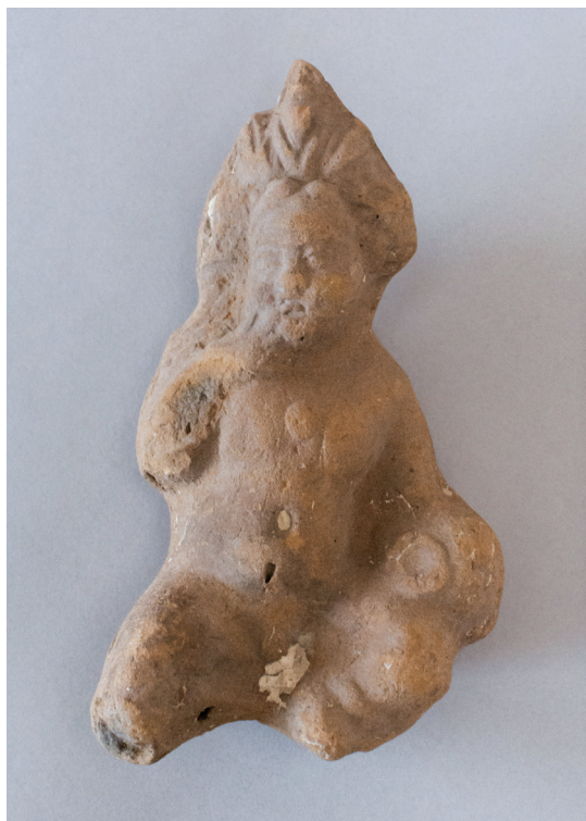
FIG. 14. – Statuette d'Harpocrate assis au pot [211]. Égypte, II e -III e siècle apr. J.-C. Haut. 12 cm. Musée du Louvre, mise en dépôt à la Sorbonne en 1921 parmi les objets issus des fouilles d'A. Gayet à Antinoé.

les états des mises en dépôt », rédigeant par conséquent une liste des « vases et terres cuites portant des numéros d'inventaire du Musée du Louvre mais n'ayant pas fait l'objet d'arrêté de mise en dépôt » 54 . S'agissant des vases, nous avons déjà noté, à la suite de Chantal Orgogozo 55 , que cette liste reposait avant tout sur une version incomplète du décret de dépôt de 1894, les diverses anomalies relevées étant en réalité bien moins nombreuses 56 . Il n'en va pas autrement pour les figurines en terre cuite. Ainsi, le pied votif MNB 1147 ou la tête d'homme barbu MNB 2342 (erronément listée par Besques comme MNB 2362) faisaient bel et bien partie du dépôt de 1894 et avaient donc toute légitimité à se trouver en Sorbonne. Notons