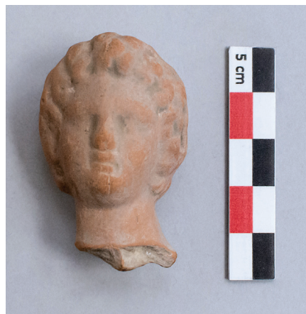
FIG. 2. – Tête féminine [273], Asie mineure, III e -I er siècle av. J.-C. Haut. cons. 4,5 cm. Don de P. Gaudin à l'Université de Paris, 1898.