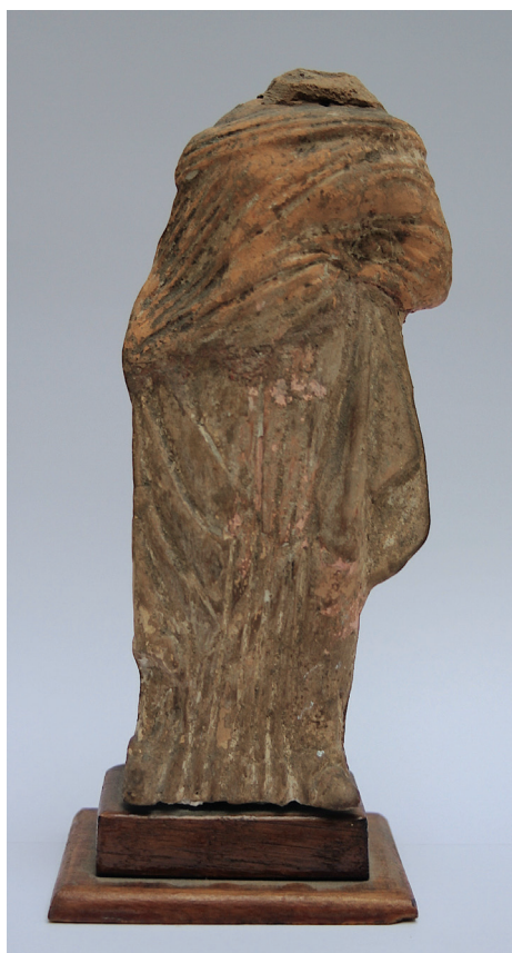
FIG. 6. – Statuette de femme drapée acéphale [203]. Italie du Sud, IV e -III e siècle av. J.-C. Haut. cons. 20 cm. Date et mode d'entrée dans la collection indéterminés.