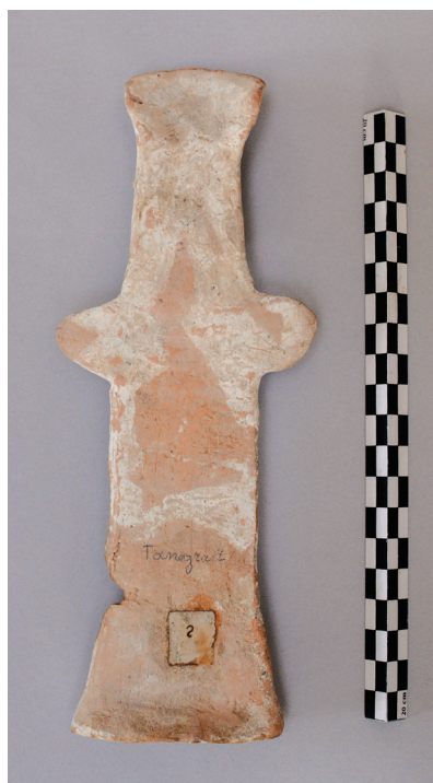
FIG. 13. – Revers de la figurine plate [204], cf. fig. 1.

provenance vraisemblable pour un tel objet béotien 38 . S'agirait-il en l'occurrence d'une pièce parvenue en Sorbonne dans le cadre du don du Royaume de Grèce ? À défaut de tout autre indice, l'hypothèse doit être formulée, quoique le parcours de cette pièce, parmi les plus belles et les plus anciennes de notre collection, demeure en réalité indéterminé.