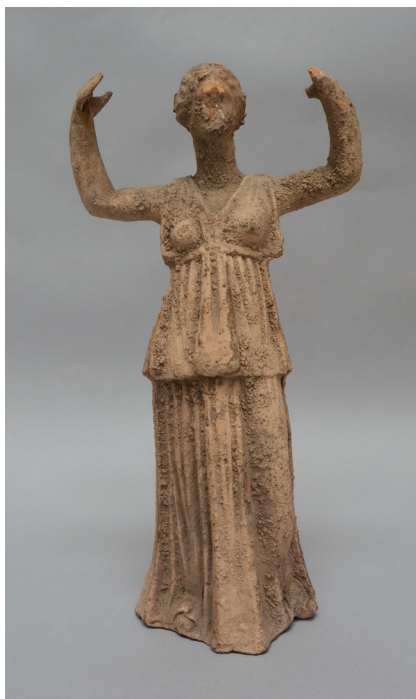
FIG. 5. – Statuette féminine aux bras levés [310]. Italie du Sud, III e -II e s. av. J.-C. Haut. 28 cm. Musée du Louvre, Cp 676. Mise en dépôt à la Sorbonne en 1894.