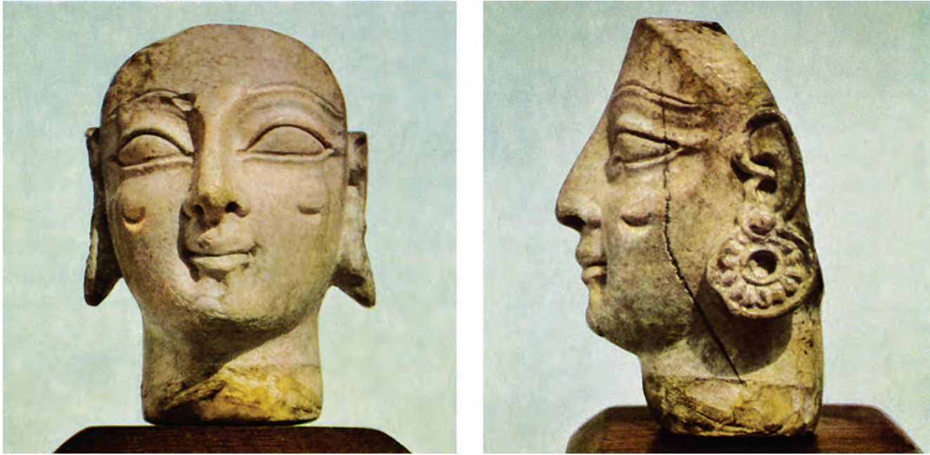
Figure 8. Tête en ivoire de Sardes.

tête de Sardes des protomés de son groupe F (« Éolide »), qui se rapporte à un atelier nord-ionien non encore identifié 69 . On y retrouve en effet les traits caractéristiques de ce groupe : structure ovale de la face, joues fuyantes, profil tendu vers l'avant et s'intégrant à un arc de cercle idéal, où nez et menton se recourbent l'un vers l'autre et referment le profil, bouche relativement étroite et charnue, et une moue caractéristique, qui creuse les commissures et fait saillir les lèvres. La tête de Sardes attesterait ainsi la présence dans la capitale lydienne d'un type de visage composé en Éolide.