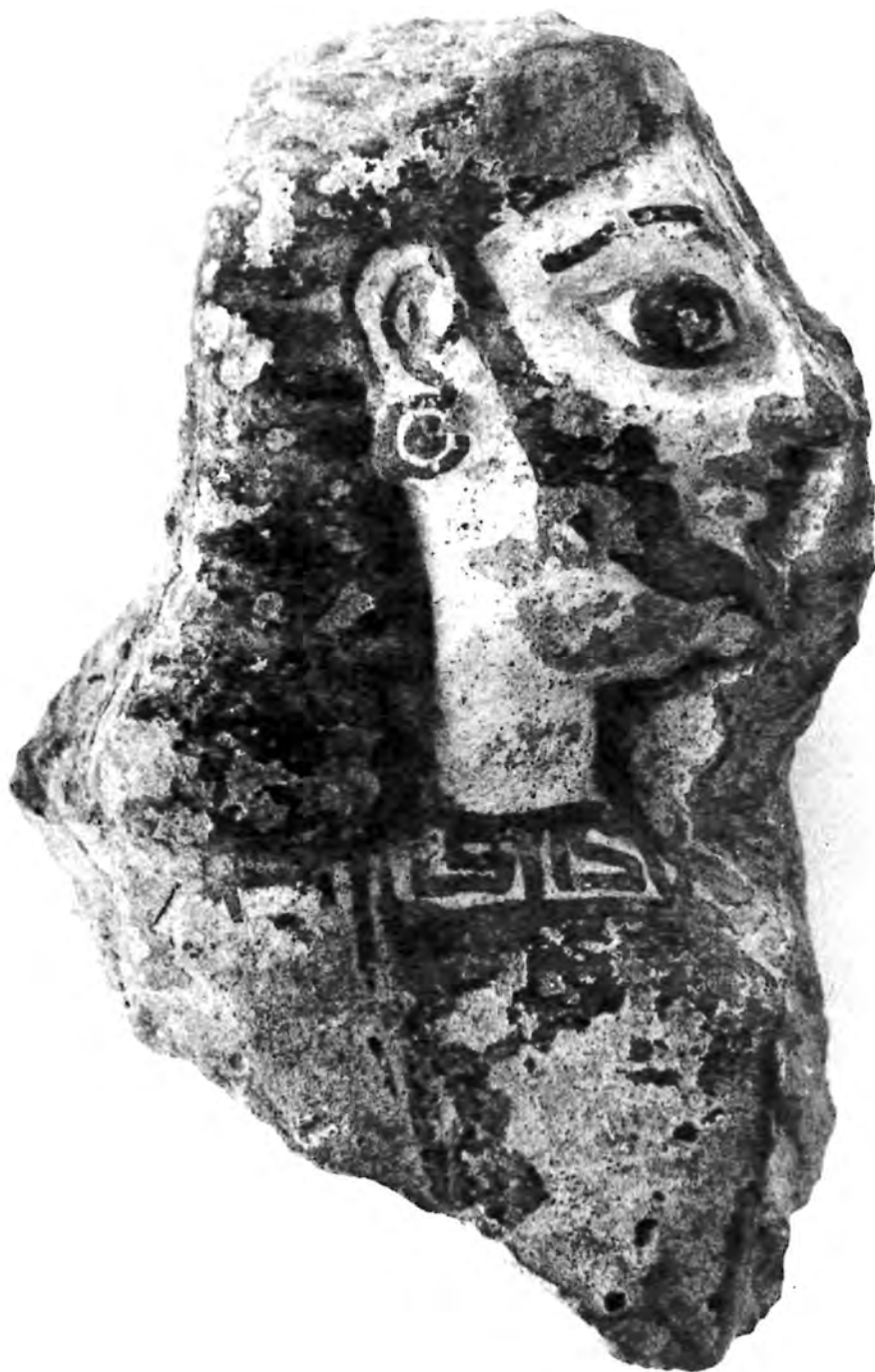
Figure 11. « Dandy » lydien.

figure un personnage assis, ithyphallique, portant une barbe (semble-t-il sans moustache), de longs cheveux jusqu'aux épaules, vêtu d'une jaquette décorée de losanges, d'un pantalon et de bottes. Le nez du personnage est perdu, de même que les bras et les jambes, sauf le pied gauche. Le corps, le phallus et les jambes ont été montés au tour, tandis que le visage a été moulé. Il fut découvert en association avec de nombreux vases lydiens et grecs, dont aucun ne semble postérieur au milieu du VI e siècle. Faire d'argile locale, cette figurine était conçue comme un vase plastique de grande dimension. Ce genre de « vase à surprise », comme il est convenu de les appeler, est comparable dans son principe au célèbre « Satyre buveur »