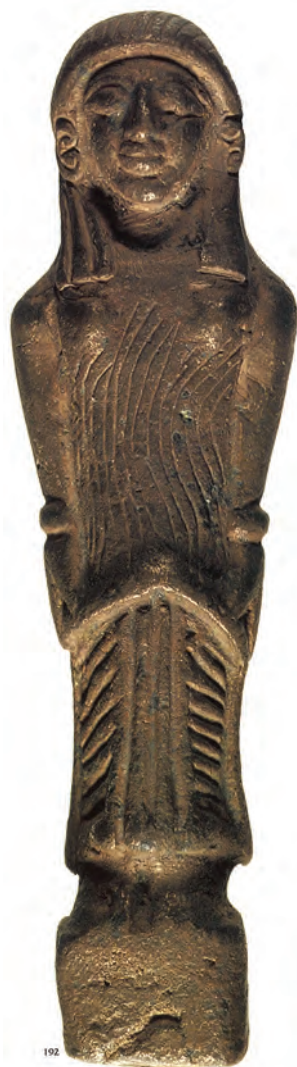
Figure 3. Matrice en bronze, femme debout.