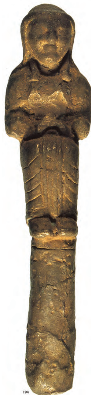
Figure 5. Matrice en bronze, femme assise.

Leur provenance exacte est malheureusement inconnue, mais il est probable qu'elles aient été pillées dans les tumuli de la région de Güre (à quelques kilomètres d'Uşak) 60 .