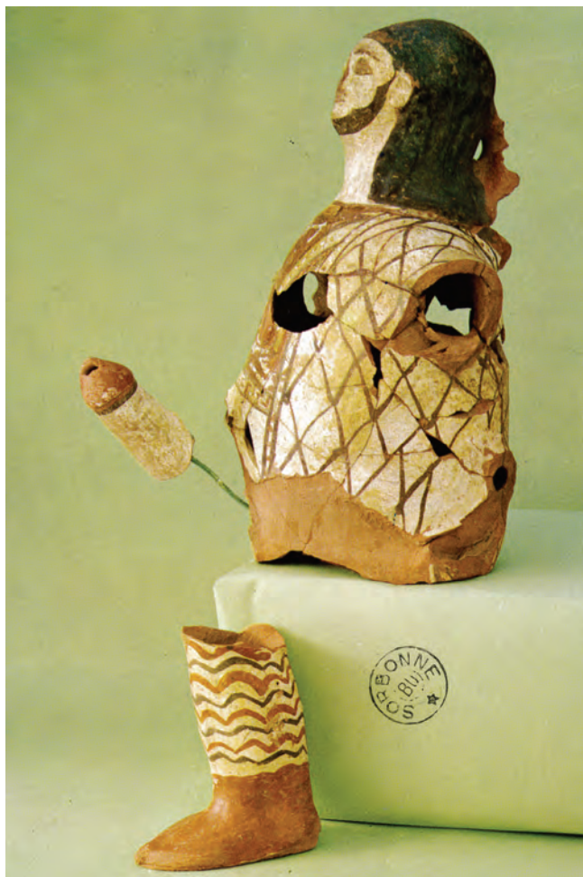
Figure 12. « Exhibitionniste ».