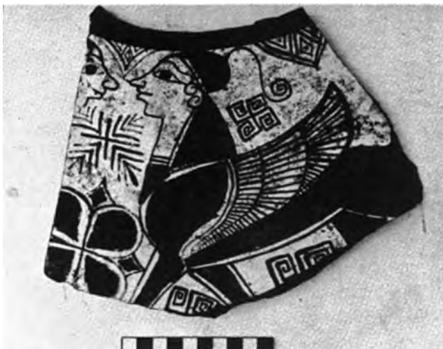
Figure 14. Tesson du style de Sardes.