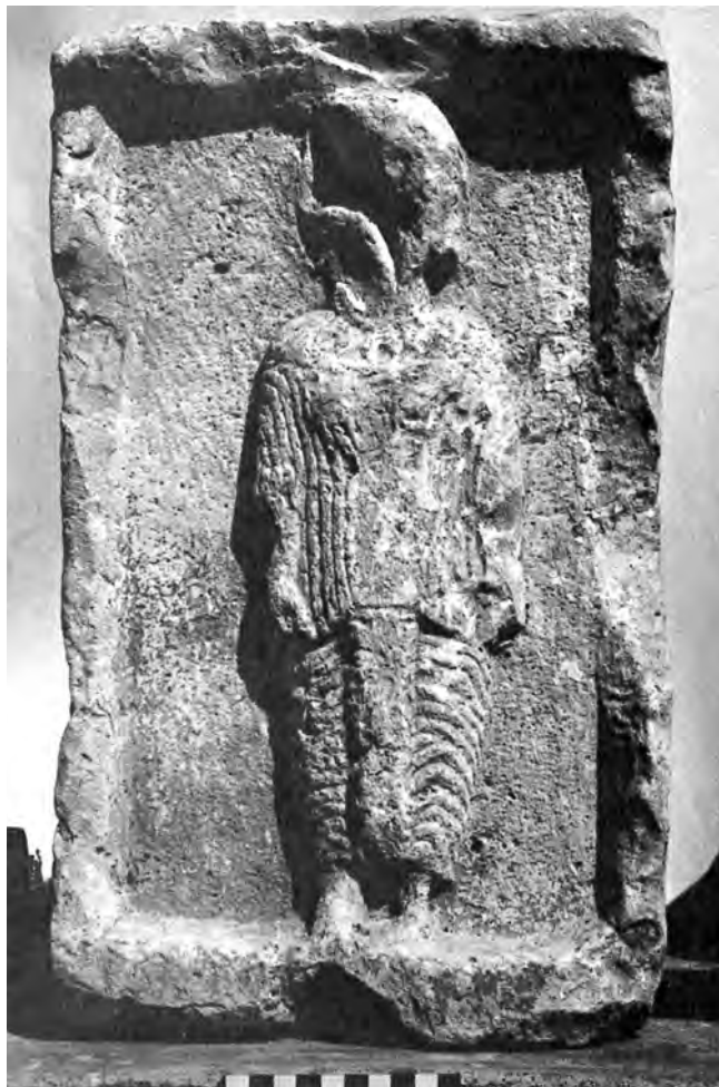
Figure 7. Relief de Sardes, femme dans un naiskos .

naiskos 61 (fig. 7). Il s'agit, semble-t-il, d'un trait emprunté à la plastique anatolienne, comme on le rencontre sur les représentations phrygiennes de Cybèle – telles la statue de Bogazköy ou les reliefs de Gordion et d'Ankara 62 – ou, plus haut dans le temps, dans la glyptique hittite. Pareille stylisation du vêtement est en effet parfaitement attestée dans l'art anatolien dès les XIX e et XVIII e siècles 63 . Si l'écart d'un millénaire pose le problème de la transmission des motifs, les arts néo-hittite et phrygien ont sans aucun doute pu servir d'intermédiaires 64 .