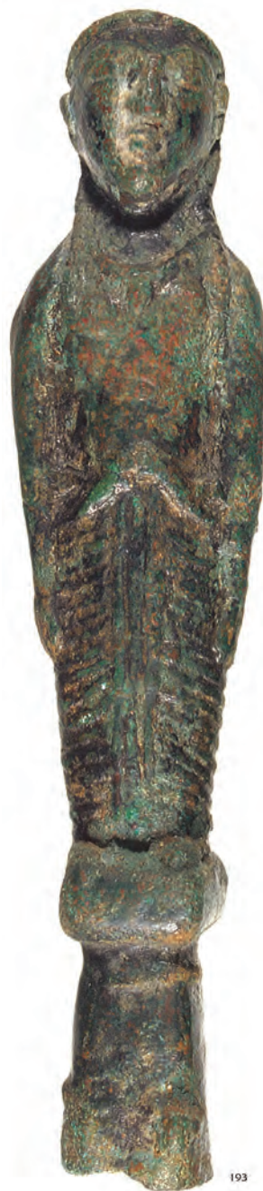
Figure 4. Matrice en bronze, femme debout.