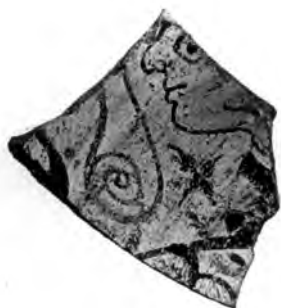
Figure 10. Tesson du style de Sardes.

Revenons à la tête en ivoire. En dépit d'un type de visage parfaitement « éolien », un autre élément plaide cependant en faveur d'une création lydienne. Il s'agit des deux incisions en forme de croissant de lune, qui sont sans parallèle dans la plastique grecque. Il ne s'agit sans doute pas de l'indication des fossettes, comme le pensait Butler 73 , mais plus vraisemblablement de véritables signes distinctifs permettant d'identifier le personnage. R. D. Barnett proposait d'y reconnaître un tatouage ou une marque au fer rouge désignant une « esclave du dieu-lune » ; il fut généralement suivi 74 . Toutefois, aucun dieu-lune n'est à ce jour connu en Lydie à l'époque archaïque 75 , tandis que Mên – auquel semblait penser Barnett en renvoyant à l'étude de J. Keil 76 –, certes connu à Sardes par un relief hellénistique 77 , est une divinité dont la plus ancienne attestation – de surcroît attique – ne remonte pas au-delà du IV e siècle 78 . L'identification définitive n'est donc pas encore acquise, mais les deux incisions en forme de croissant paraîtraient bien étranges sur une œuvre grecque ou en contexte grec. Par défaut, on y verra donc un trait « lydien ».