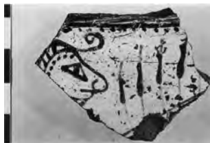
Figure 9. Tesson du style de Sardes.