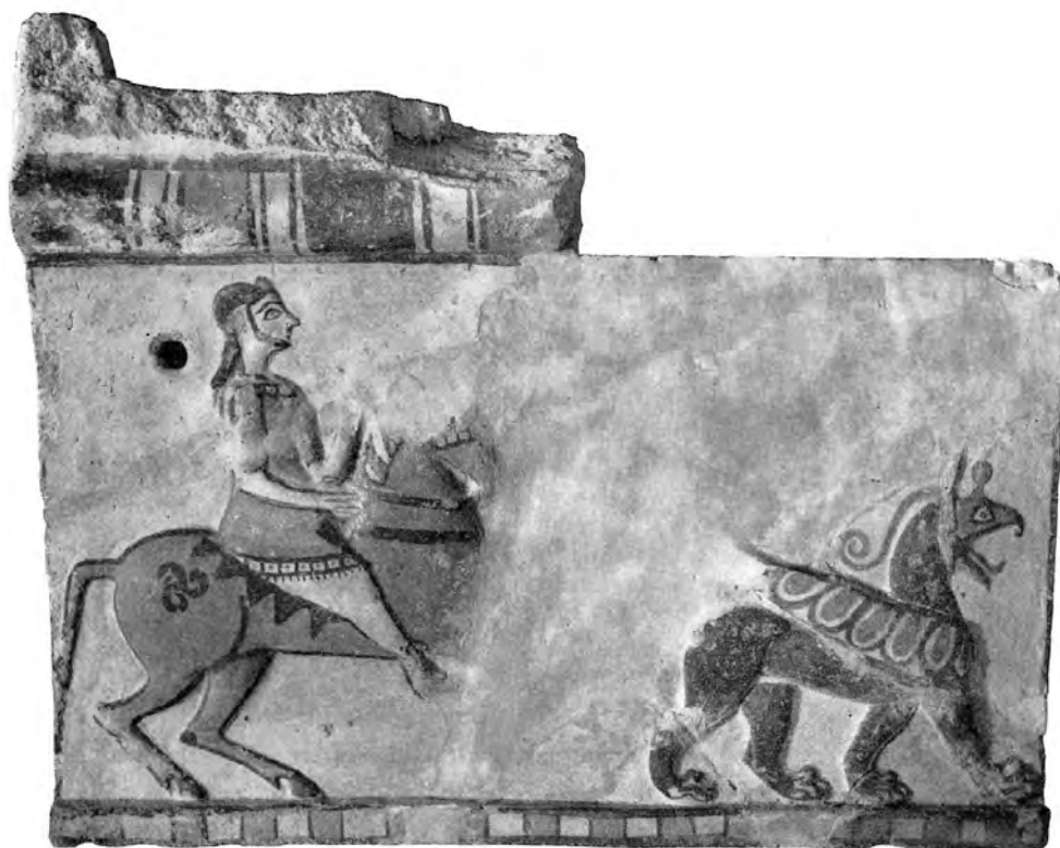
Figure 15. Terre cuite architecturale de Stockholm.