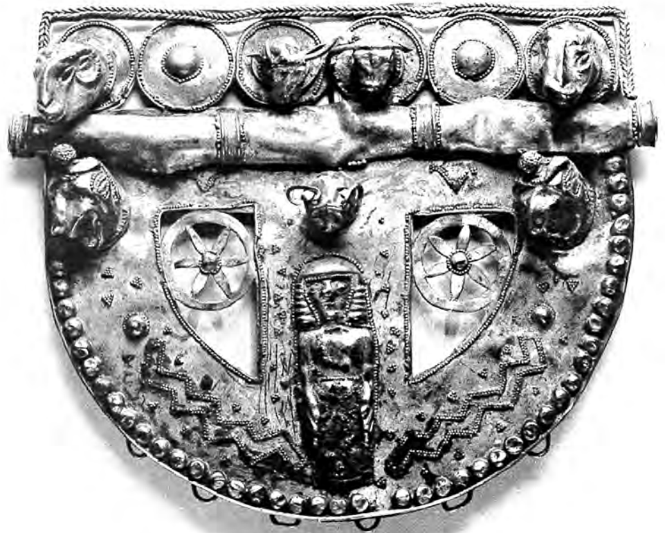
Figure 1. Pendentif orientalisant d'Aydın (Tralles).

De toutes ces merveilles, il ne reste malheureusement rien et on ne peut s'en faire une idée qu'à partir de quelques pièces d'orfèvrerie conservées. L'un des objets les plus anciennement connus est conservé au Louvre (fig. 1). Il s'agit d'un pendentif en or découvert au