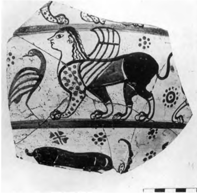
Figure 13. Tesson du style de Sardes.